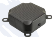
Module simple bas